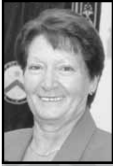
Is-Sinjura Carmen Cini - Chairperson